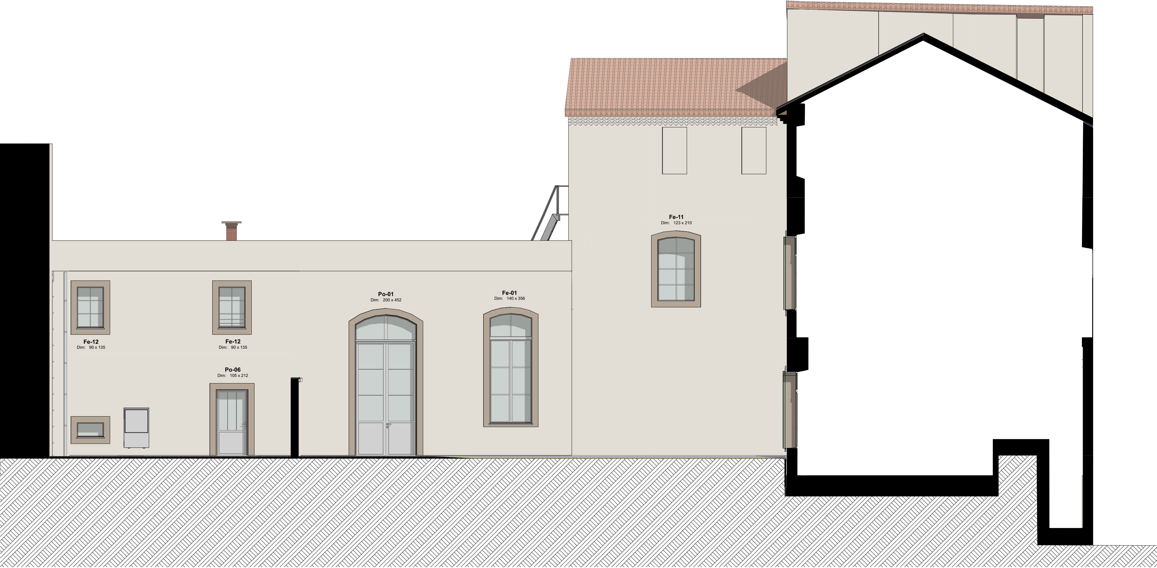
FAÇADE NORD PROJET - CÔTÉ COUR - 1/75